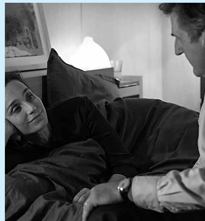
Filme está no Festival Varilux de Cinema Francês