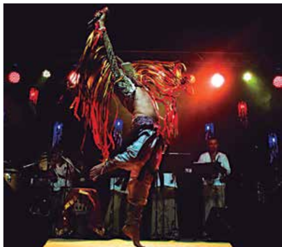
Banda Brasis, show no próximo domingo