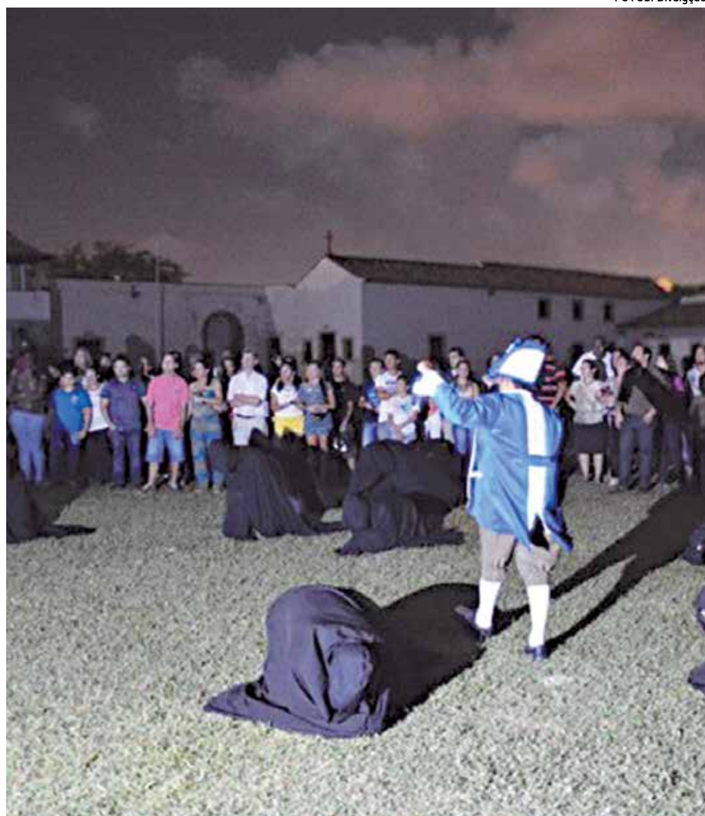
Cena da Paixão de Cristo (lado) retrata o calvário de Jesus enquanto a foto (acima) revela o público assistindo o espetáculo na Fortaleza de Santa Catarina, conhecida pela sua beleza e importância histórica

limitação de público é necessária para o bom andamento do espetáculo, evitando qualquer interferência externa na encenação".