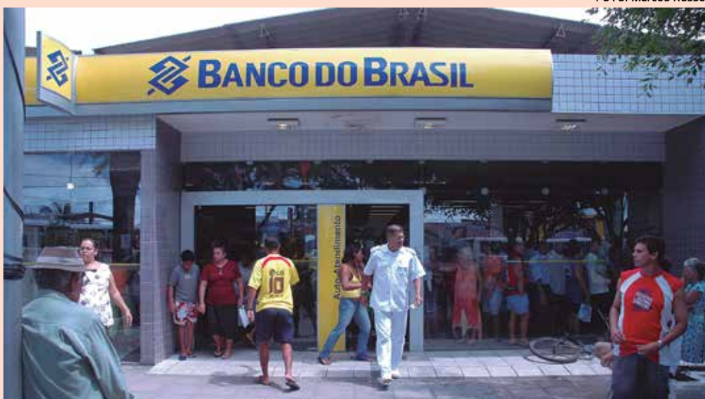
Os bancos vão abrir amanhã, mas fecham sexta-feira e só abrem na próxima terça-feira