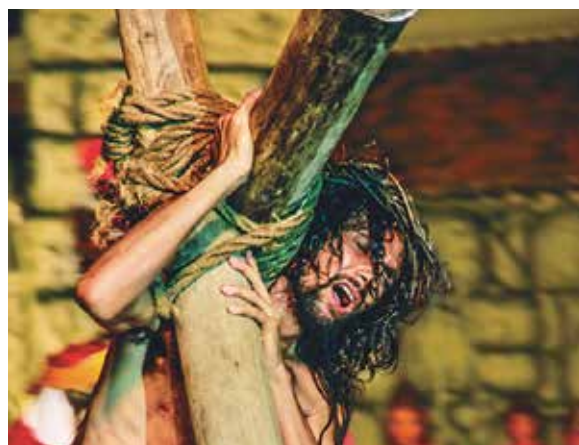
Ator interpreta Jesus em Cabedelo