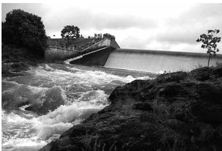
Sangradouro da barragem durante a última invernada no Sertão

O representante do Dnocs não soube precisar a quantidade de água que escoa pelo vazamento. Segundo informou, a comporta fica no