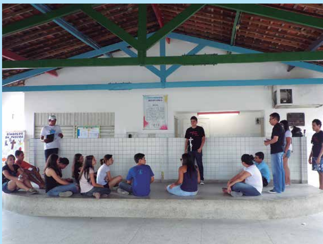
O grupo de jovens durante os ensaios, que tiveram início no mês de janeiro

A peça contará a trajetória de vida de Jesus Cristo, passando pela anunciação do nascimento, os milagres, a condenação, a Via Sacra, a