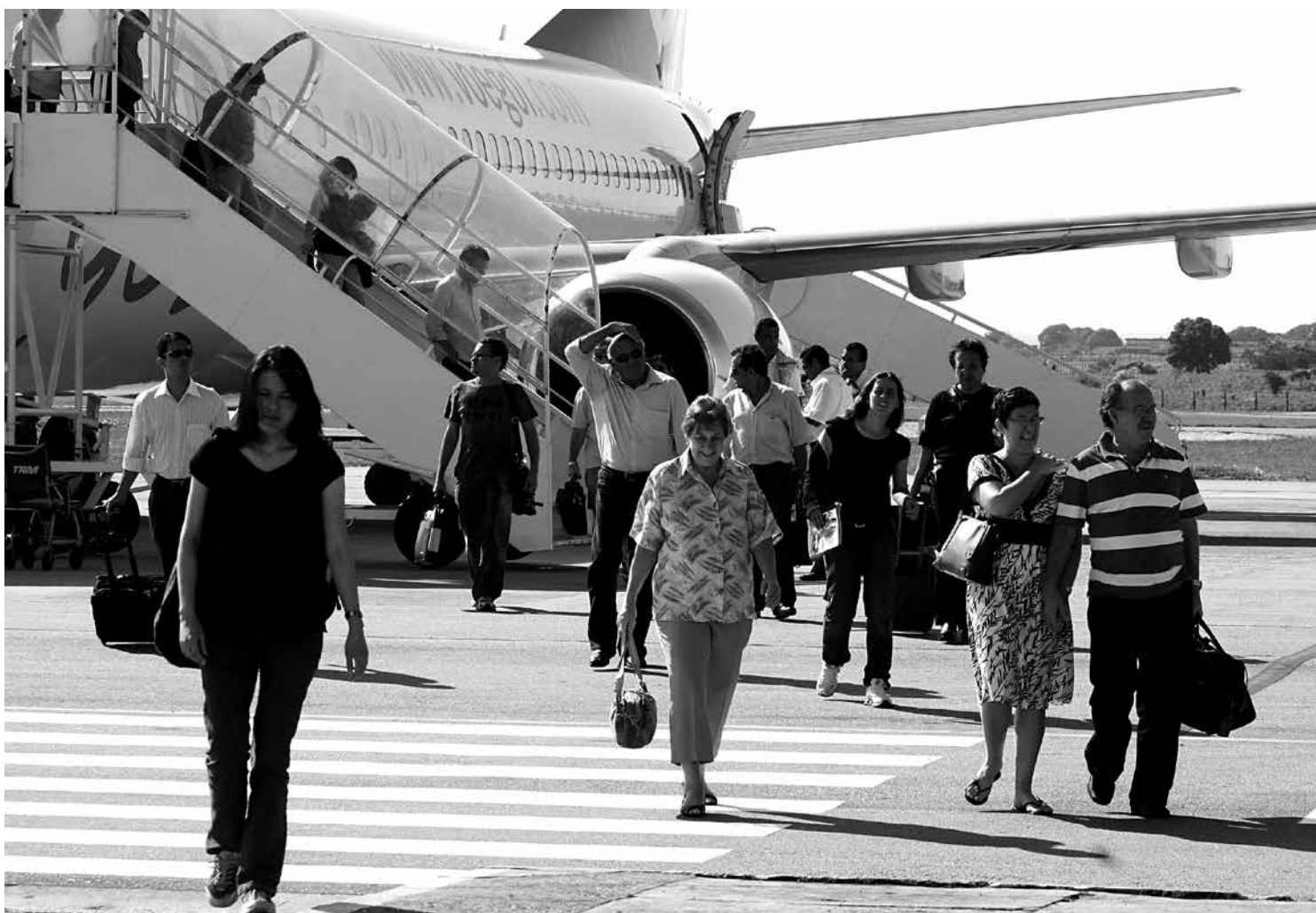
Desembarque de passageiros somou 334.215 nos três meses deste ano, diante de 310.964 registrados no mesmo período do ano passado

A movimentação de passageiros tem sido positiva em 2014. No primeiro trimestre, o crescimento do número de desembarques foi de 7,71%. Foram 159.595 passageiros contra 148.166 registrados no ano passado. Em março, o aumento foi de 10,37%. Em relação ao número de embarques, em março deste ano houve alta de 10,06%, comparado com o mesmo período de 2013. No trimestre, a alta foi de 5,95%, com 174.620 passageiros embar-