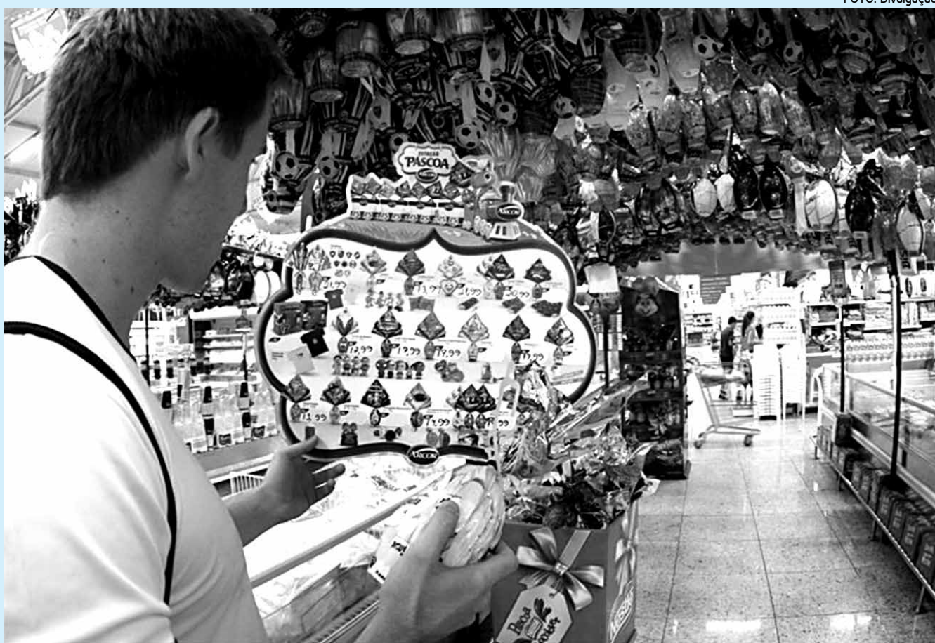
Os ovos de Páscoa ficaram 6,78% mais caros, em média, em comparação com o mesmo período do ano passado

A pesquisa do Ibre, divulgada hoje, no Rio de Janeiro, mos-