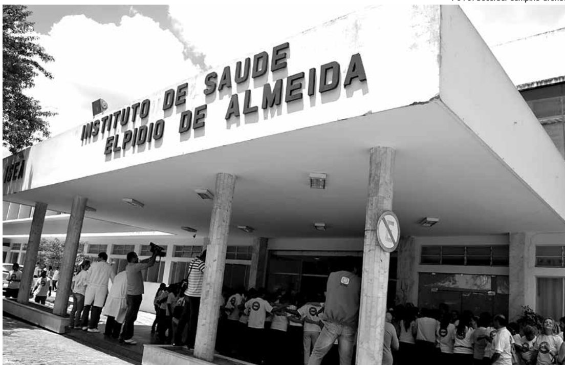
Médicos, enfermeiras e demais servidores do Isea, ontem, de mãos dadas, envolvendo todo o prédio