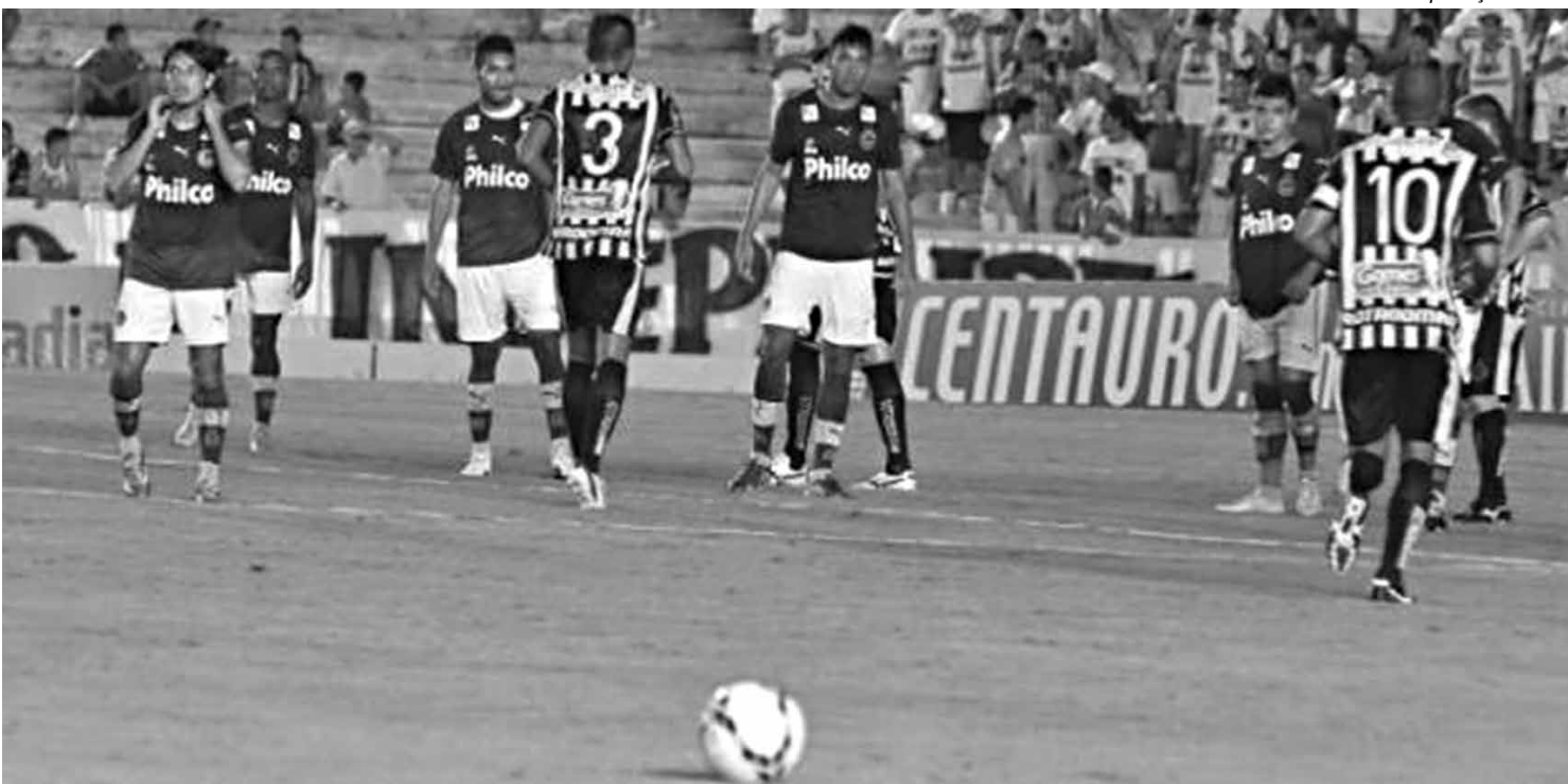
No Almeidão, o Botafogo deu um show diante do Goiás ao vencer por 2 a 0 e até se dá o luxo de perder uma penalidade máxima

Auto Esporte tenta fugir da lanterna hoje contra o Santa