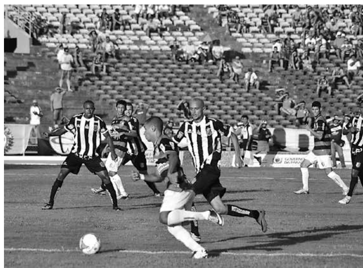
Derrotado pelo Campinense, o Galo busca hoje a reabilitação

Sousa encara o CSP no Marizão e pode ser líder do 2º turno